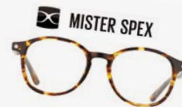
Brillen von Mister Spex

Zum Beispiel: Cumulocity. Wir verkauften unsere Beteiligung erfolgreich an die Software AG.